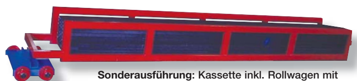
Sonderausführung: Kassette inkl. Rollwagen mit vier kugelgelagerten Spurkranzrädern