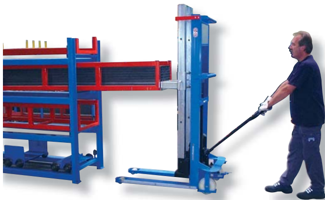
Ausrollbock in die Kassette einhängen, anheben und ausziehen.