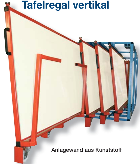
Anlagewand aus Kunststoff

Bitte tragen Sie die relevanten Daten ein.