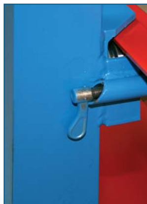
Einzelverriegelung der eingeschobenen Fächer.