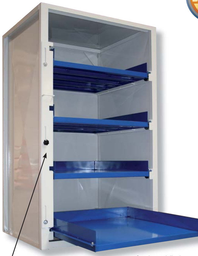
Schieber für Fachfreigabe