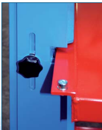
Nur ein Fach z.Z. ausziehbar.

Auf Wunsch auch Sonderlackierungen, Sonderformate, andere Fachanzahl etc. möglich!