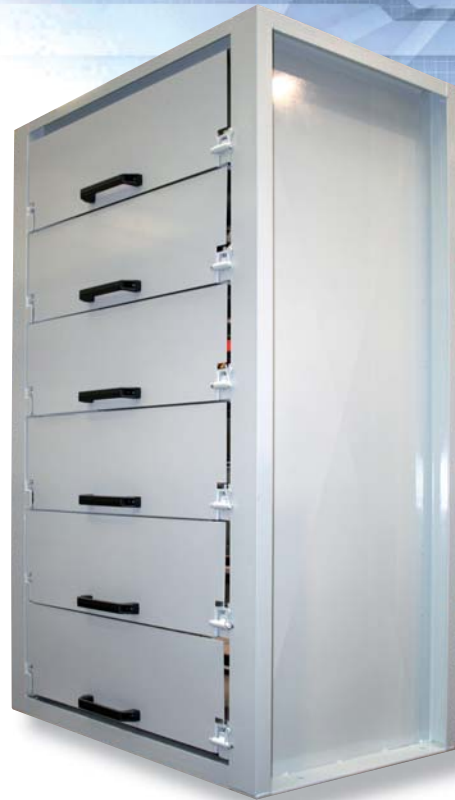
Sondermodell mit Wänden und frontseitig geschlossenen Fächern