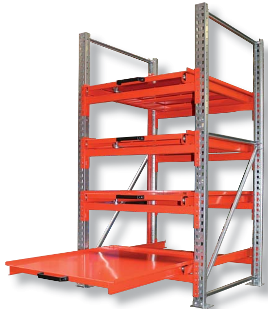
Ausführung ohne Dachablage