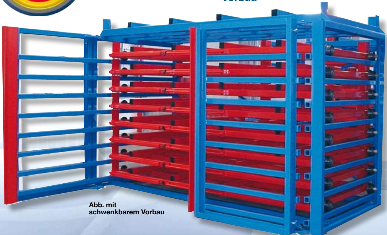
Abb. mit schwenkbarem Vorbau