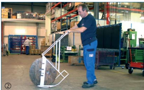
② Die eingesteckte Achse der Kabeltrommel wird an passender Stelle in den Abroller eingeführt.