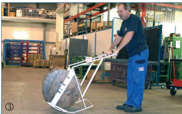
③ Durch Herunterdrücken der Griffereinheit kommt die Kabeltrommel in eine frei hängende Position.