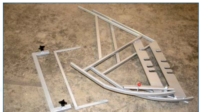
Zerlegt leicht zu transportieren