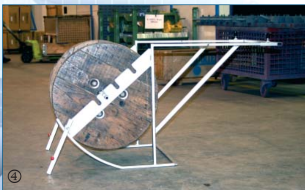
④ Die ausklappbaren Stützen sorgen für sicheren Halt - das Kabel kann jetzt abgetrommelt werden.