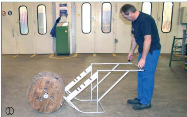
① Der Abroller wird an die Kabeltrommel positioniert.