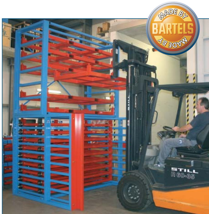
Ausführung mit integrierten Staplertaschen

Auf Wunsch: Ausführung des Magazins und der Paletten bezüglich Maße, Traglast und Anzahl der Lagerplätze frei wählbar.