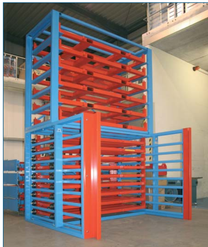
Ideal in Kombination mit dem Schubfachregal für Bleche

Mittenabstand der Gabeltaschen: 850 mm; lichte Taschenweite: 148 x 68 mm; Traglast pro Palette bis zu 2000 kg; Paletten sind 6-fach stapelbar (6 Paletten übereinander); Lackierung: Gestell blau RAL 5012; Paletten rot RAL 2002.